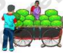
రవి పనస పండు కొంటున్నాడు