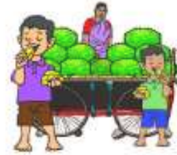
పిల్లలు పనస తొనలు తింటున్నారు.

(ఇ) కింది బొమ్మను చూడండి. పదాన్ని చదవండి. అక్షరాలను చదవండి. ఈ అక్షరాలను వర్ణమాల చార్టులో గుర్తించండి.