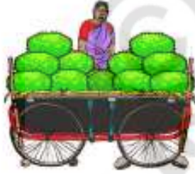
బండిమీద పనస పళ్ళు ఉన్నాయి.

(ఆ) కింది బొమ్మలను చూసి వాక్యాలు చెప్పండి. కింది వాక్యాల్లో “పనస” పదానికి ‘○’ చుట్టండి.