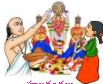
పూలదండలు పూజారికి ఇచ్చింది.