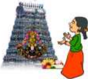
పాప గుడికి బయలుదేరింది

(ఇ) కింది బొమ్మలను చూడండి, వాక్యాలను చెప్పండి. కింది వాక్యాల్లో ' ం ', ' ా ' ఉన్న అక్షరాలకు '○' చుట్టండి. చదవండి.