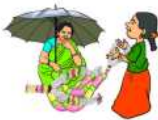
దారిలో పూలదండలు కొన్నది